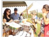
İzmir'de tohum şenliği