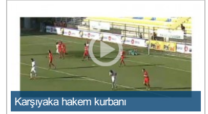
Karşıyaka hakem kurbanı