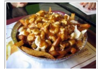
Dünyanın en meşhur yemekleri