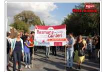
Basmane günleri başladı