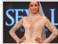
Ko'tan gelinlik yaptılar